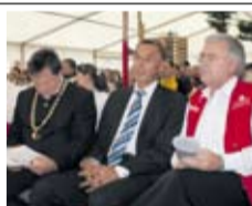
Landrat Fleschhut und Kaufbeurens Oberbürgermeister Bosse