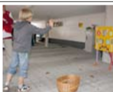
Spiel, Spaß und Spannung gab es auch für die kleinen Besucher.