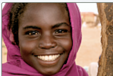
Kinder stehen im besonderen Fokus der humedica-Hilfe in Sudan.