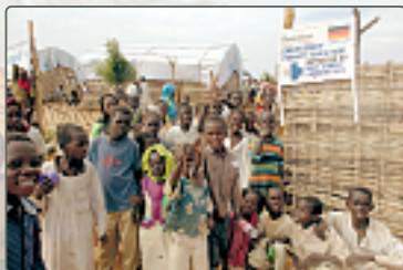
humedica betreut mit Unterstützung des Auswärtigen Amtes drei Camps in Darfur mit mehr als 200.000 Flüchtlingen.