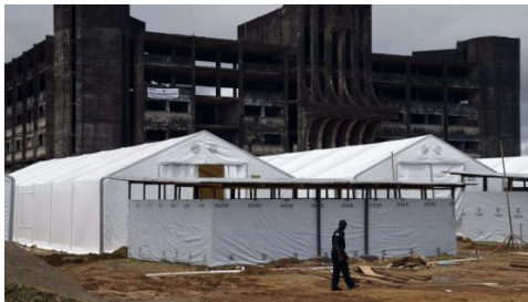
Diese Unterkünfte für Ebola-Kranke in Monrovia sind beinahe fertiggestellt – doch stündlich werden neue Verdachtsfälle gemeldet, die untergebracht werden müssen

Die Situation läuft Gefahr, vollends außer Kontrolle zu geraten: Die Klinik in Monrovia ist maßlos überfüllt, Krankenzimmer werden aus demselben Grund für Tode ab. Die Hilfskräfte kommen einfach nicht hinterher mit dem Bau weiterer Unterkünfte.