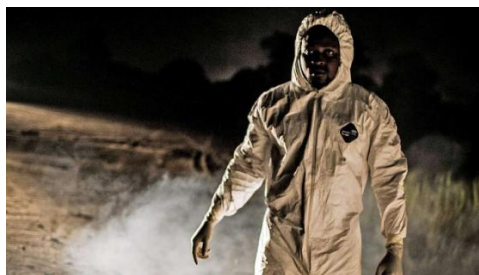
Ein fast schon alltäglicher Anblick in Liberia: Ein Helfer entsorgt im Schutzanzug infizierte Leichen

Doch es gibt auch Hoffnung: Vereinzelt melden Isolierstationen die Entlassung von Überlebenden der Seuche. Doch bevor die Menschen zu ihren Familien zurückkehren dürfen, werden sie am ganzen Körper desinfiziert, bekommen neue Kleidung, ja sogar neue Matratzen – zu groß ist das Risiko, dass sich der Erreger zu Hause eingenistet haben könnte.