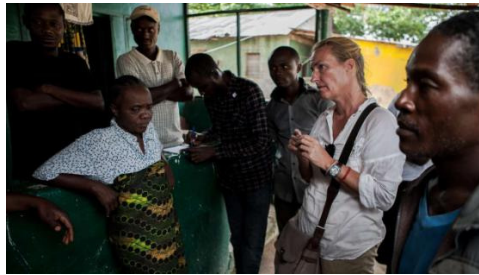
Ortstermin in Dolo – in diesem Dorf starben 200 Menschen an dem Todesvirus

in den letzten Wochen als „Ebolas Gefängnisstadt“ zu zweifelhaftem Ruhm gelangt war. Dort sind seit Ausbruch der Krankheit mehr als 200 Todesopfer zu beklagen, lange Zeit war die ganze Stadt eine einzige Quarantänezone.